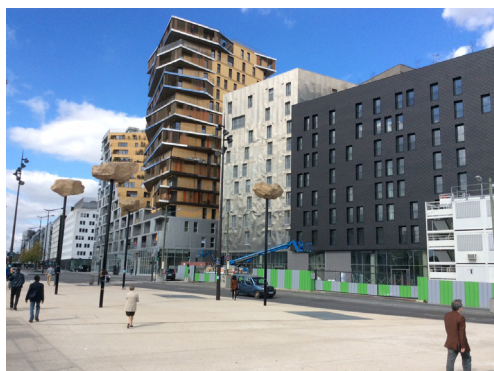
L'avenue de France vers les Maréchaux