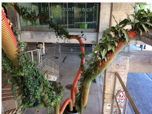
L'installation d'Alexandre Tricoire à la Cité de la mode et du design

L'année démarre pour les terminales avec une visite impromptue de l'installation de Georges Rousse , Paravents, à la Conciergerie.