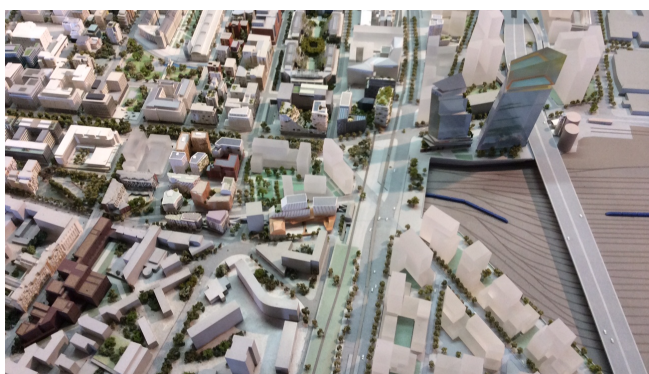
Au point d'information de la Semapa : la maquette de l'emprise. Détail des futures Tours de Grande Hauteur entre boulevards des Maréchaux et périphérique.